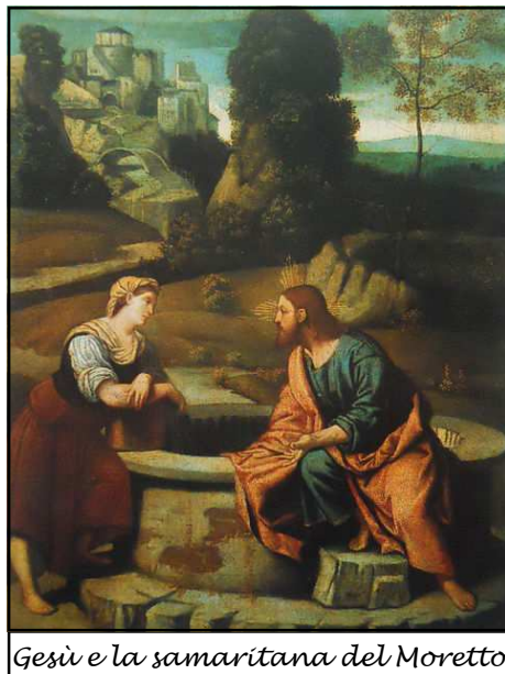
Gesù e la samaritana del Moretto

otici del post Concilio Vaticano II) diede alla luce la rivista internazionale Communio e dai primi anni ottanta è direttore dell'edizione anglo-americana. Ora è professore di teologia presso l'Istituto Giovanni Paolo II di Washington.