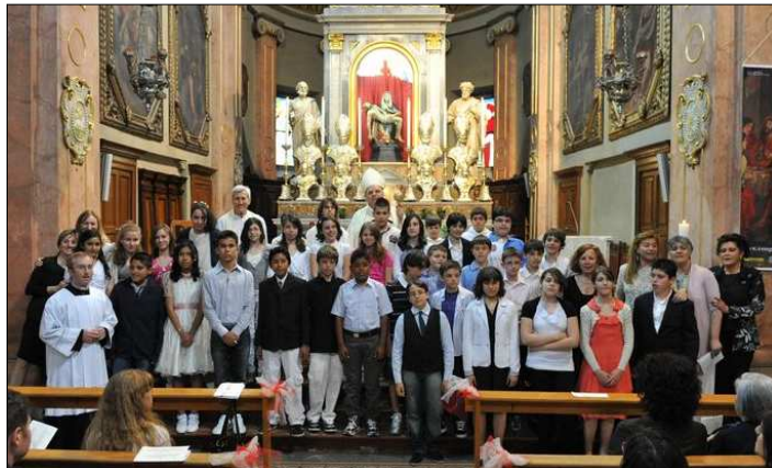
Cresime: 2° gruppo sabato 21 maggio