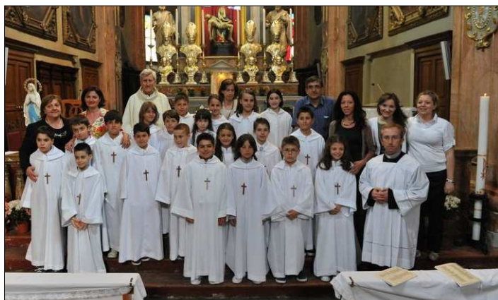
Comunioni: 2° gruppo domenica 22 maggio