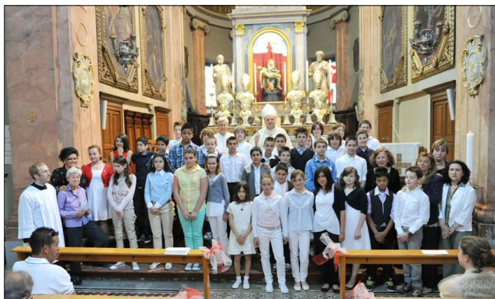
Cresime: 1° gruppo sabato 21 maggio