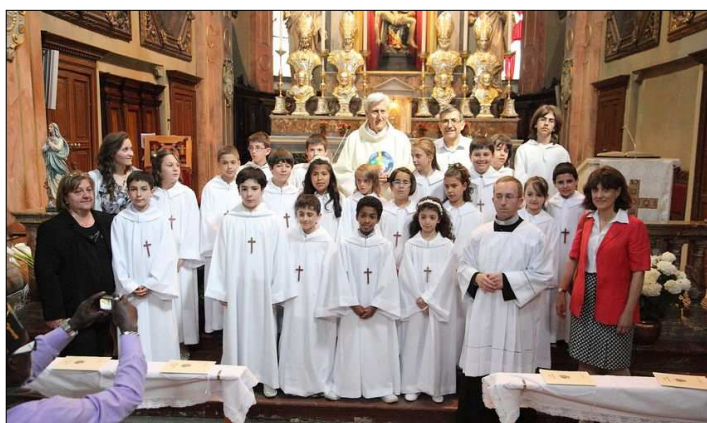
Comunioni: 1° gruppo domenica 29 maggio