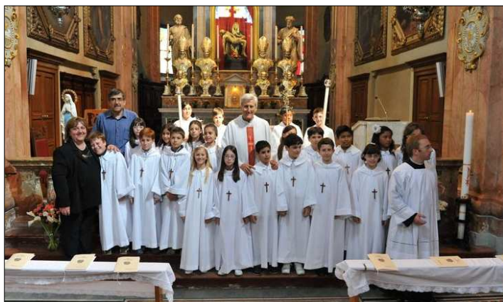
Comunioni: 1° gruppo domenica 22 maggio